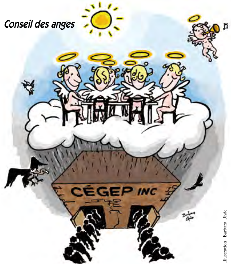
Illustration : Barbara Uhlé

Les réformes en matière de composition du conseil d'administration prévoient notamment la rémunération des membres et la parité hommes-femmes. Elles favorisent également la représentation des membres externes, devenus des « membres indépendants ».