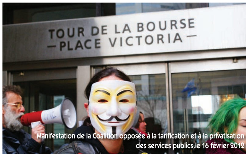
Manifestation de la Coalition opposée à la tarification et à la privatisation des services publics, le 16 février 2012

Enfin, je tiens à préciser à nos camarades de la droite que les syndicats sont un puissant facteur de réduction des inégalités sociales et économiques et que leur perte d'influence, au cours des 30 dernières années – en raison notamment d'une législation qui limite beaucoup leur champ d'action et leur pouvoir de négociation –, a participé à l'accroissement de ces inégalités 6 .