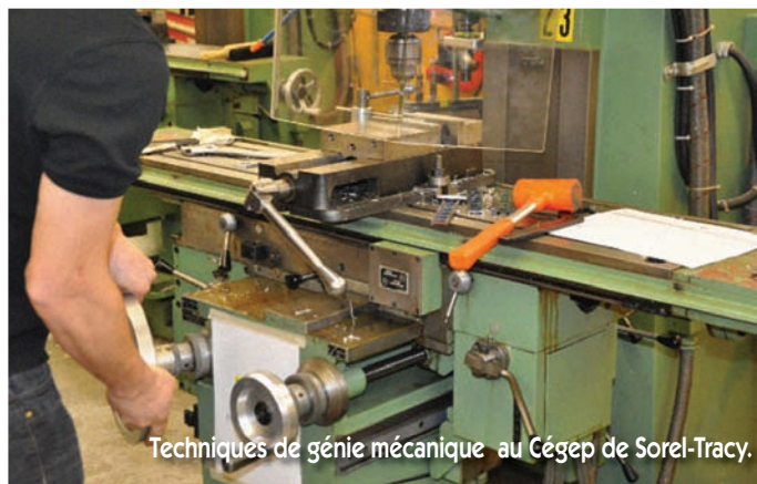
Techniques de génie mécanique au Cégep de Sorel-Tracy.

Le second objectif, qui vise à évaluer la pertinence de dégager des « programmes d'études plus génériques »,