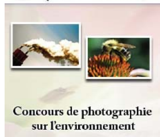
Concours de photographie sur l'environnement

Organisé par le Comité pour l'environnement du Syndicat des professeurs du Cégep de Sainte-Foy.