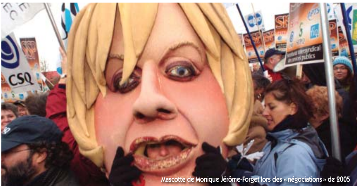
Mascotte de Monique Jérôme-Forget lors des « négociations » de 2005

Cette vision de l'employeur plombe la négociation collective et l'empêche de progresser à son rythme. Par son attitude, ses propos et son intransigeance, il a donc négocié de mauvaise foi en ce qui concerne le volet salarial de la négociation collective.