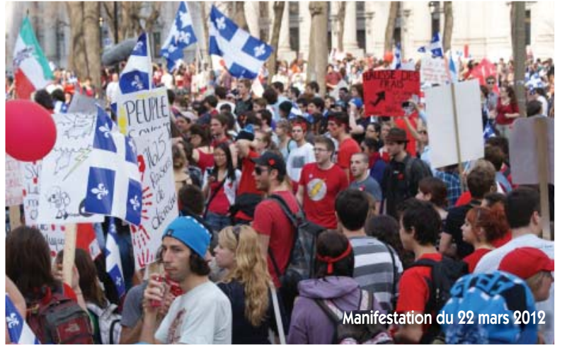
Manifestation du 22 mars 2012

À travers leurs moyens d'action, leurs modes d'organisation et leurs revendications, les étudiantes et les étudiants ne visent pas seulement un élargissement des droits sociaux qui sont rattachés à leur statut, mais surtout une contestation des normes régissant leur existence au cours de cet instant précis de leur vie, car, et on l'a vu, les transferts de l'État en enseignement supé-