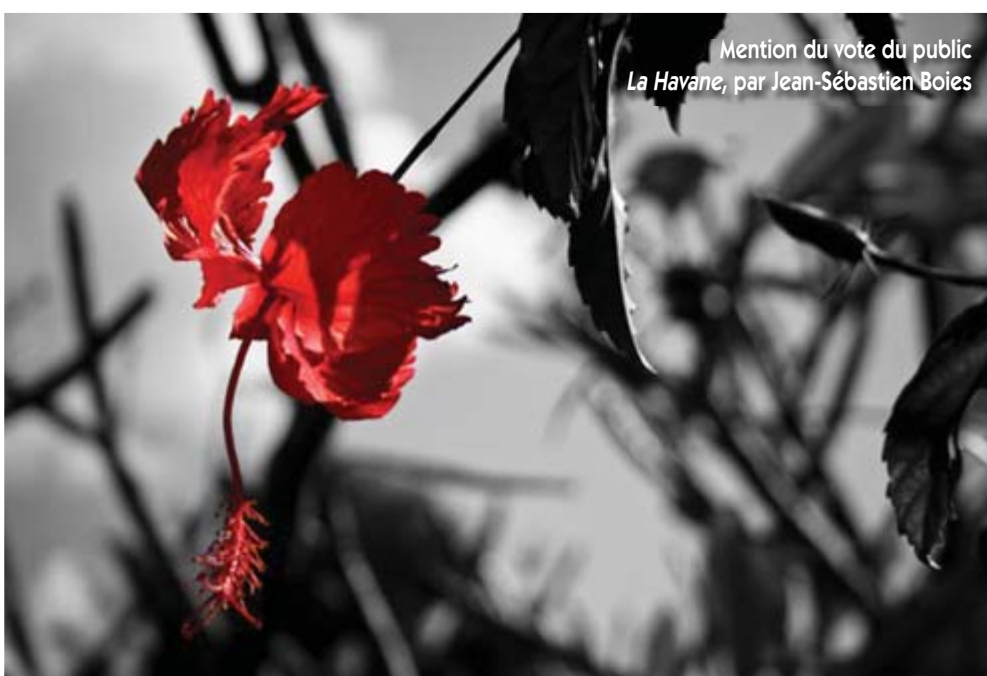
Mention du vote du public La Havane , par Jean-Sébastien Boies